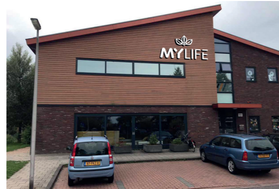
MyLife Purmerend Zambezilaan 181 1448 ME Purmerend T: 0299 472 961